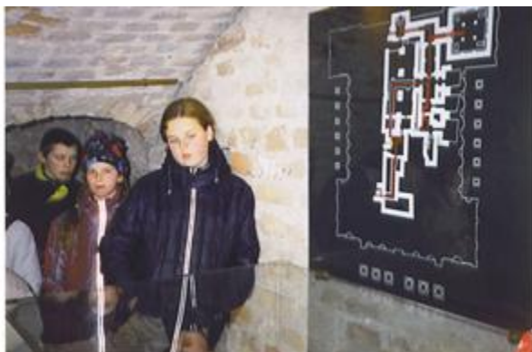
Pagramančio mokyklos vaikai ekskursijoje po Vilnių, Archikatedros požemiuose.

Alanto Vidurinė Mokykla, Molėtų r.: Lithuanian Citizen's Society of Western Pennsylvania, PA.