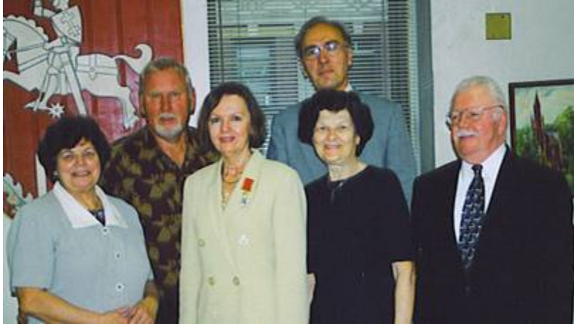
Nauja Tautos Fondo valdyba