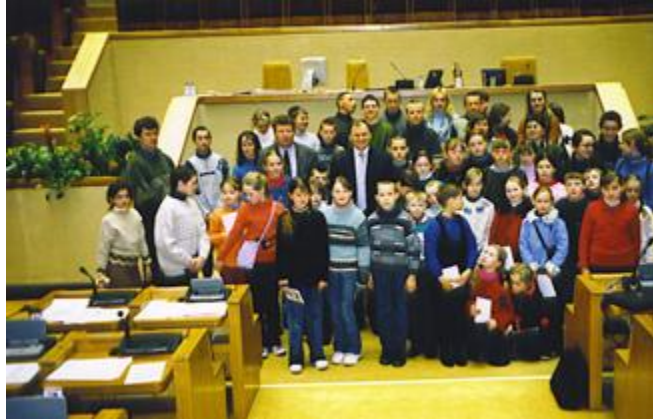
Pagramančio pagrindinės mokyklos mokiniai L.R. Seimo rūmuose